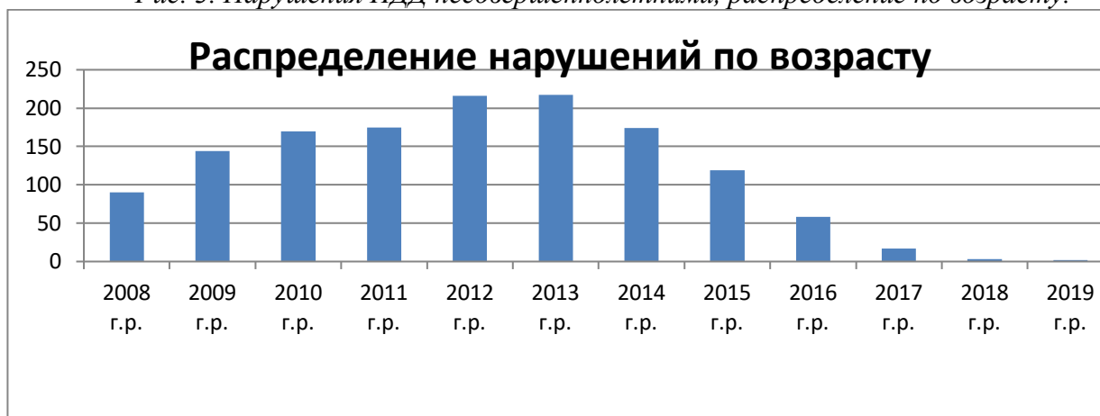
Рис. 3. Нарушения ПДД несовершеннолетними, распределение по возрасту.

Сделав выборку по образовательным учреждениям, было выявлено, что учащиеся следующих красноярских учебных заведений, а именно: