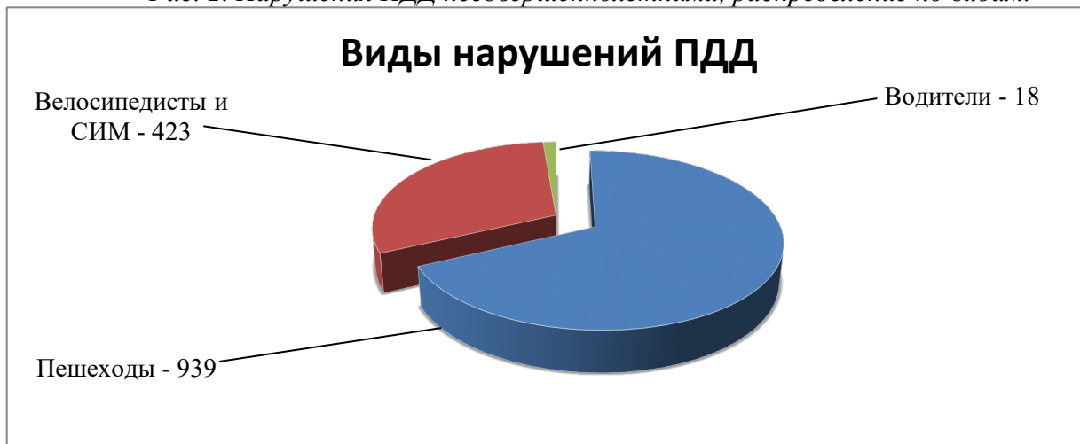
Рис. 2. Нарушения ПДД несовершеннолетними, распределение по видам.

Анализируя возрастные характеристики несовершеннолетних, нарушивших ПДД, можно сделать вывод, что к группе риска относятся дети 10-13 лет, которые характеризуются стойкими проявлениями «переходного возраста», психофизиологическими изменениями личности и импульсивностью поведения (рис. 3).